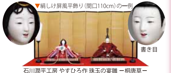
▼絹しけ屏風平飾り(間口110cm)の一例