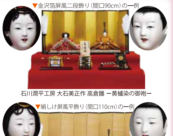
▼金沢箔屏風二段飾り(間口90cm)の一例