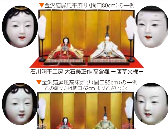
▼金沢箔屏風平飾り(間口80cm)の一例

いろいろな飾り方 ライフスタイルに合わせての 組み合わせをご相談ください 石川潤平工房のおひな様は8万8千円より、 木目込のおひな様は13万円位よりございます。