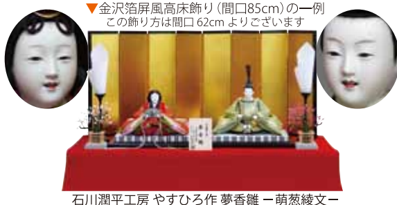
▼金沢箔屏風高床飾り(間口85cm)の一例 この飾り方は間口62cmよりございます