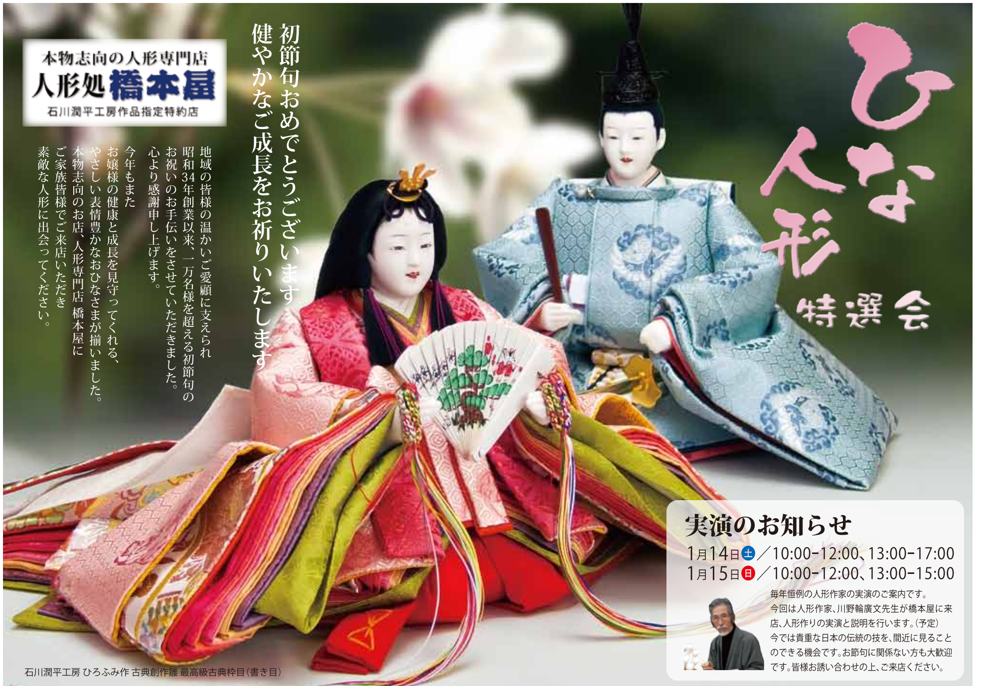
石川潤平工房 ひろふみ作 古典創作雛 最高級古典粹目(書き目)